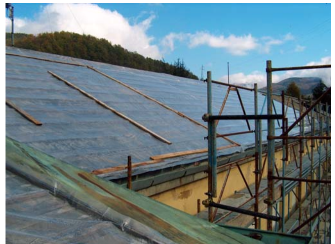
3° Sopralluogo 09-11-2006