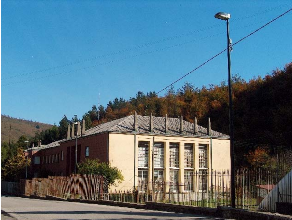
1° Sopralluogo 25-10-2005

PUNTO DI RIPRESA 1 Panoramica del fabbricato oggetto di intervento