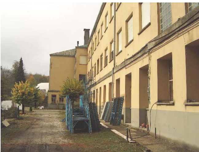
1° Sopralluogo 25-10-2005

PUNTO DI RIPRESA 2 Prospetto posteriore ripreso da Est