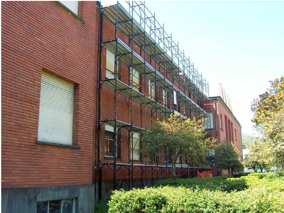
2° Sopralluogo 16-05-2006