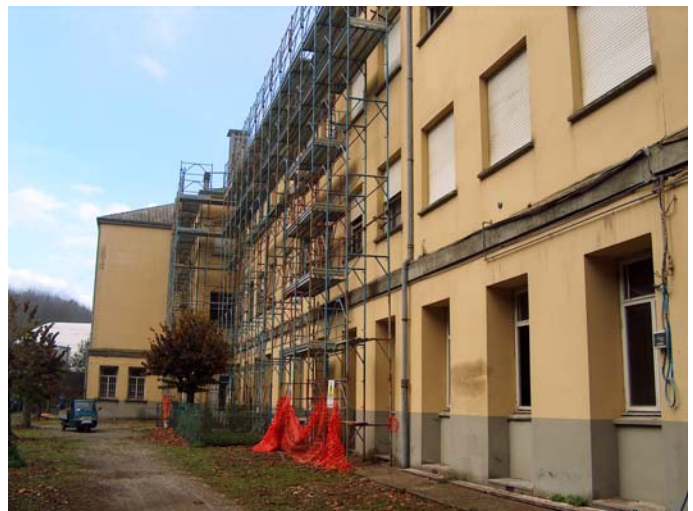
3° Sopralluogo 09-11-2006