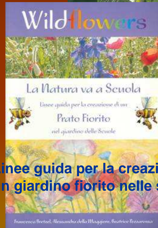
Linee guida per la creazione di un giardino fiorito nelle scuole