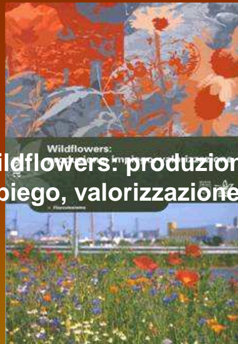
Wildflowers: produzione, impiego, valorizzazione