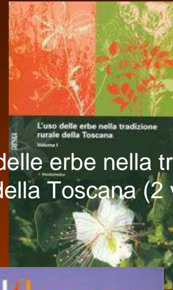
L'uso delle erbe nella tradizione rurale della Toscana (2 volumi)