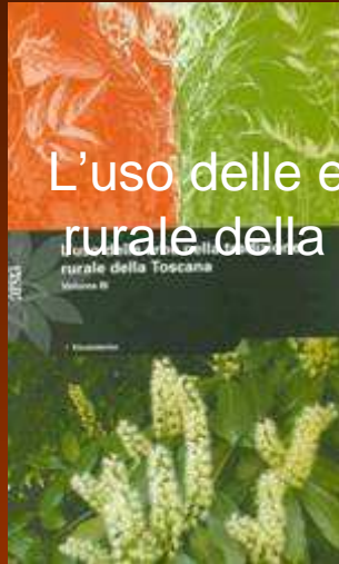
L'uso delle erbe nella tradizione rurale della Toscana (3 volumi)