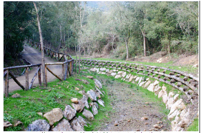
Alveo e strada a monte del guado (visibile in primo piano) – dopo i lavori