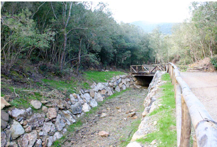
Lo stesso scorcio dopo i lavori: in luogo del guado c'è un ponte "naturalistico"