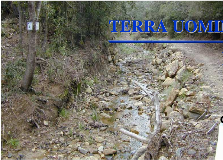
Alveo del fosso Caubbio a valle dell'originario guado, visibile sullo sfondo, prima dei lavori