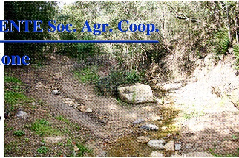
Alveo e strada a monte del guado (visibile in primo piano) – prima dei lavori