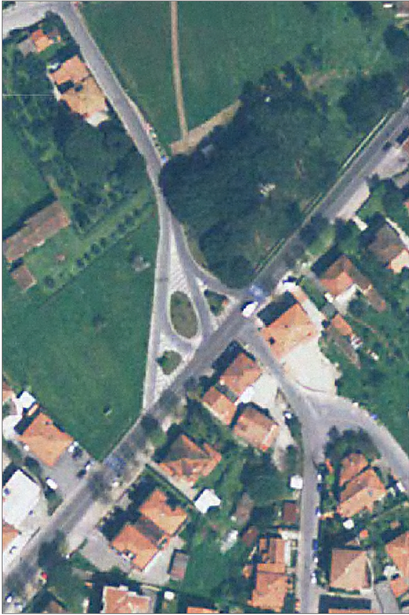
Planimetria da ortofoto - (fuori scala)